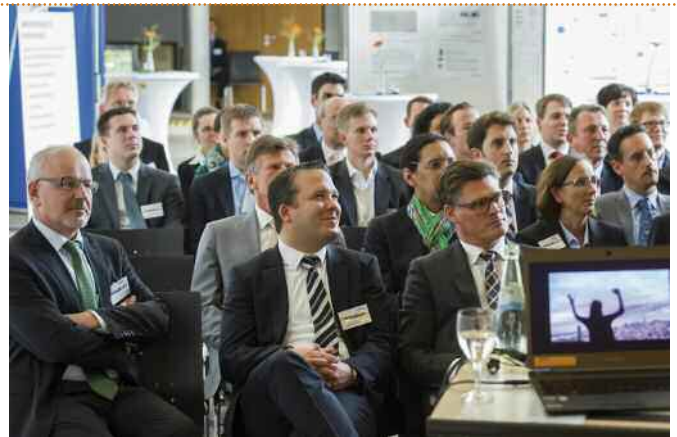
VII. SIE Meetingpoint 2014