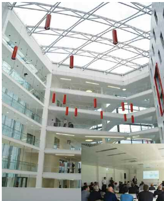
House of Logistics and Mobility (HOLM), Frankfurt